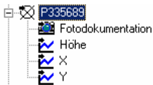
Abbildung 5: Geodätische Messstelle mit Unterknoten 'X' und 'Y'

Wenn die Vererbungsmöglichkeit aufgrund der Knotenexistenz festgestellt wird, wird ausschließlich der entsprechende Modus durchgeführt, auch wenn er kein Ergebnis liefert (keine Datensätze, keine entsprechenden Felder innerhalb der Datensätze, ...; in die Felder für die Lagekoordinaten wird in diesem Fall jeweils 0 eingetragen).